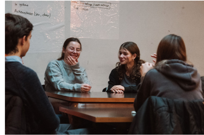
Le Jury des jeunes (12-14 ans)