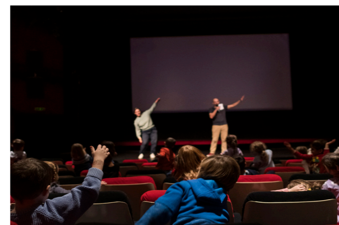
Projection du programme Métamorphoses pour des classes de 1P