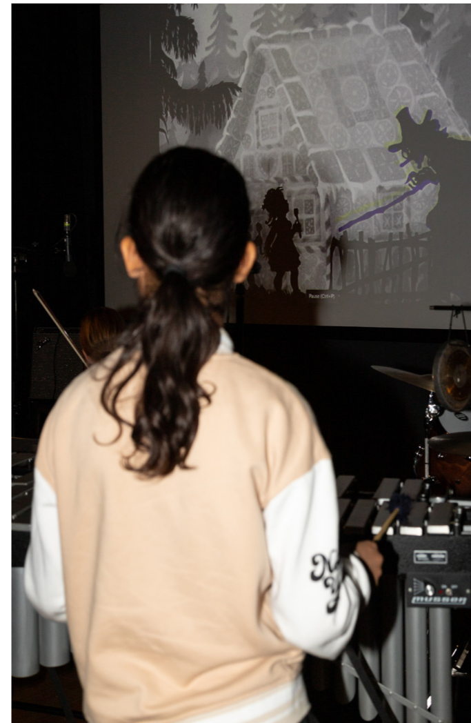
Atelier de création musicale autour du film Contes & Silhouettes à l'EJMA