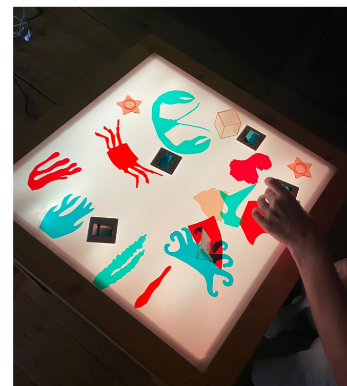
Rencontre entre professionnel-le-x-s de la petite enfance et de la culture au Centre de vie enfantine de Petit Venes