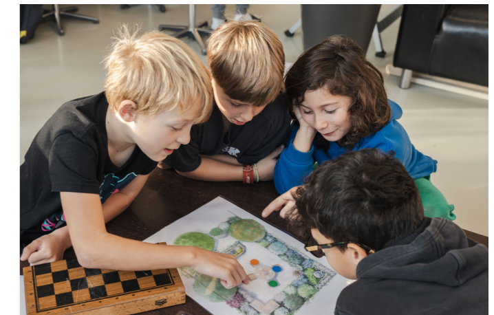
Atelier doublage Linda veut du poulet en classe