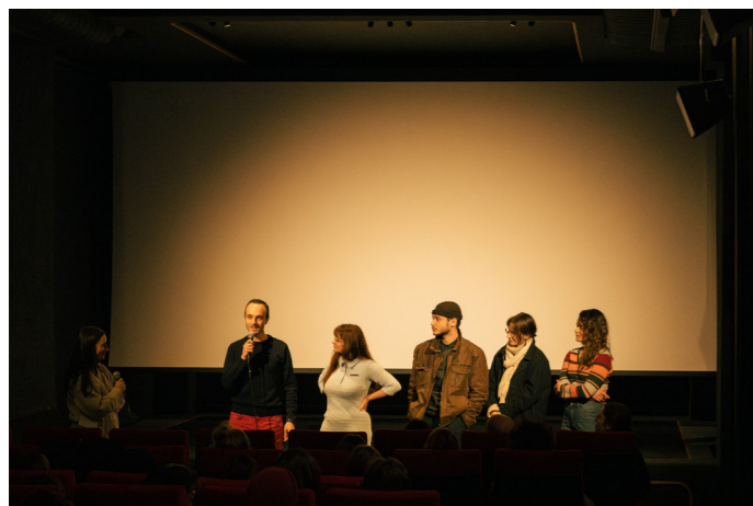
Les jeunes réalisateur·trice·x·s présentent leur court métrage lors de la séance Films de la jeune création romande