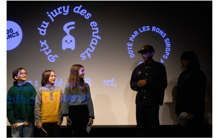
Le Jury des enfants (8-12 ans)