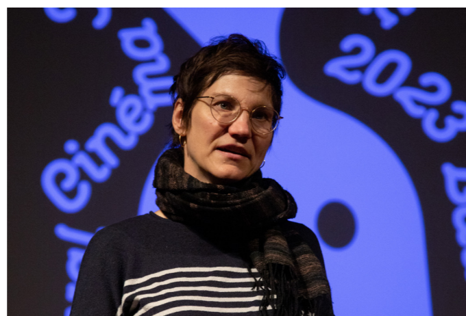
Thirza Ingold, réalisatrice de Kill your Darlings