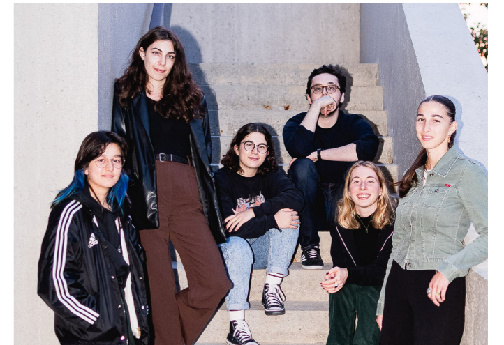
Le comité de programmation des jeunes