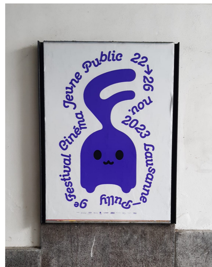
L'affiche de la 9e édition ©Nouchine Diba

En constante évolution, la manifestation a maintenu ses efforts de visibilité des activités de médiation et de découverte de films originaux dans le but de capter l'attention et d'attirer de nouveaux cinéphiles, mais aussi de jeunes talents ainsi que de nouveaux partenaires locaux.