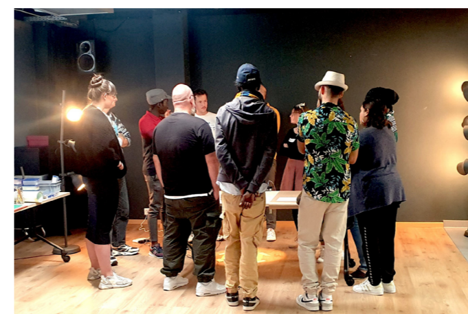
Formation à la technique stopmotion pour les professionnel-le-x-s de l'accueil parascolaire des APEMS