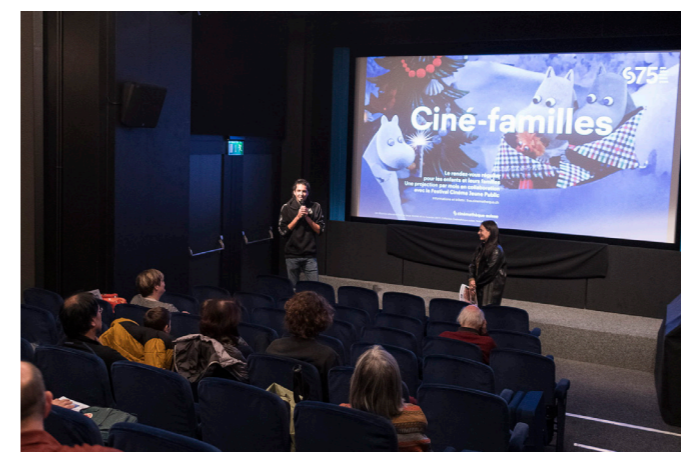
Projection Ciné-familles à la salle du Cinématographe de la Cinémathèque suisse de Lausanne