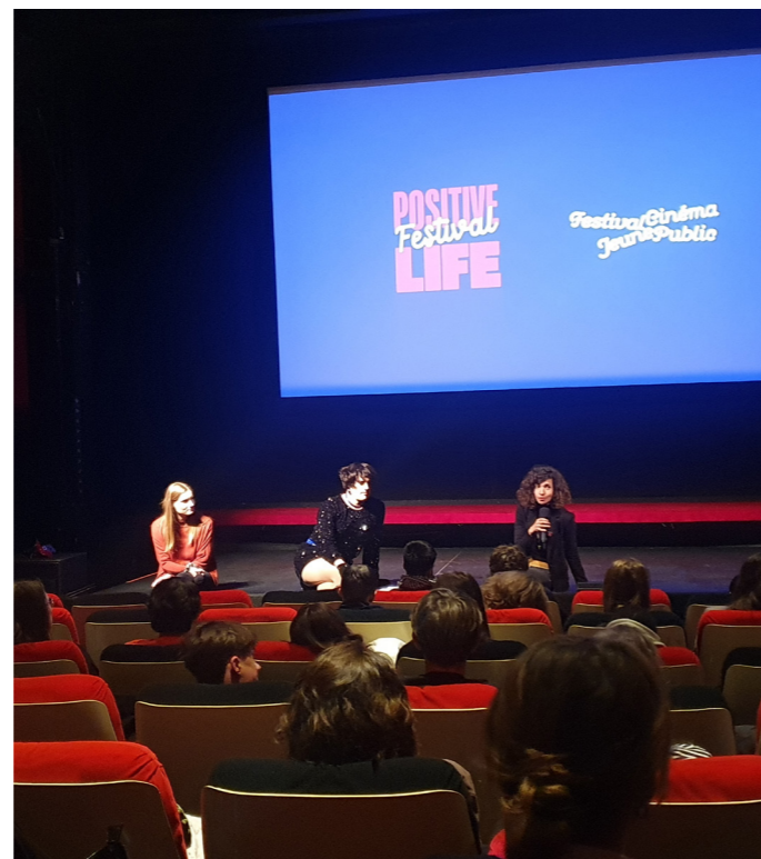
Discussion dans le cadre du festival « Positive Life » avec les patient·e·x·s de la Maïeutique

L'offre pour les écoles a une fois encore remporté un grand succès en 2023. Une sélection de trois longs métrages et cinq programmes de courts métrages a été proposée pour les classes de tous niveaux scolaires, de la primaire jusqu'au postobligatoire. Des fiches pédagogiques ont été conçues par l'équipe de médiation afin de proposer aux enseignant·e·x·s des activités à réaliser avant et après les projections, en lien avec les films.