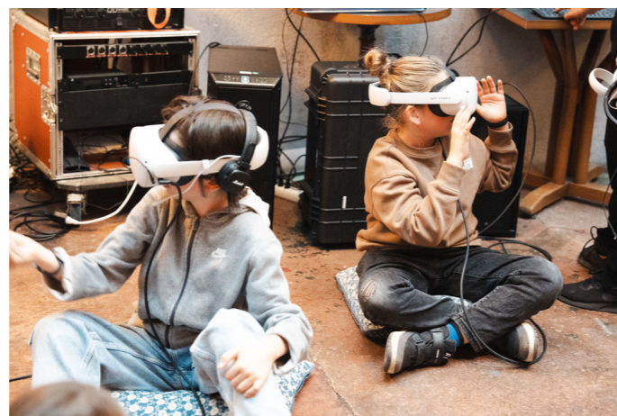
Expérience de réalité virtuelle Sen au Zinéma