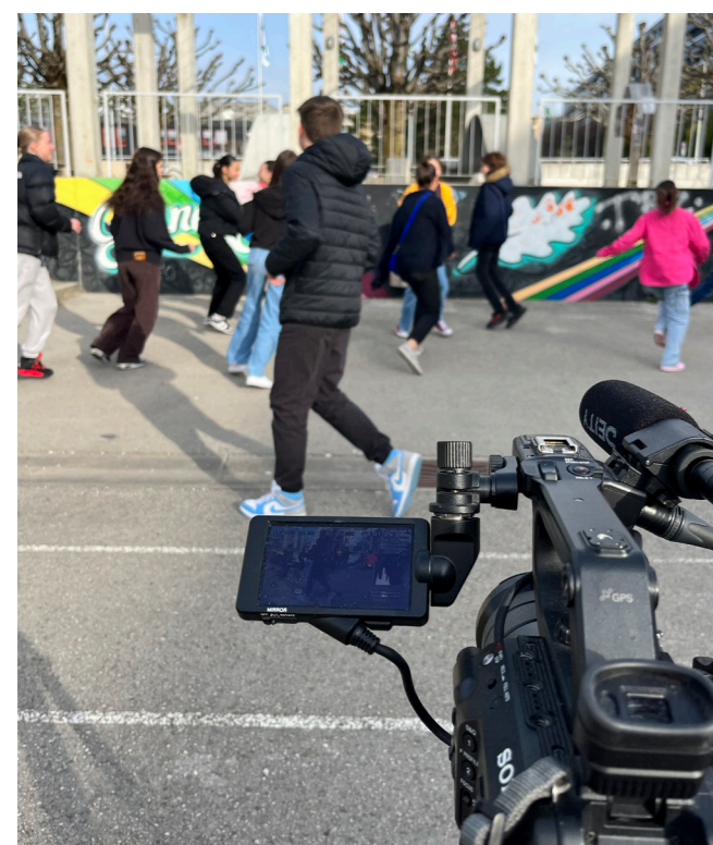
Atelier réalisation de documentaire à l'Établissement Grand-Champ à Gland

En collaboration avec le Positive Life Festival et avec la réalisatrice vaudoise Marie-Eve Hildbrand, des élèves de l'Établissement secondaire de Grand-Champ à Gland ont participé en avril à un atelier de réalisation sur la thématique du regard de l'autre. Le film a été montré lors de plusieurs projections publiques pendant le «Positive Life Festival» en décembre.