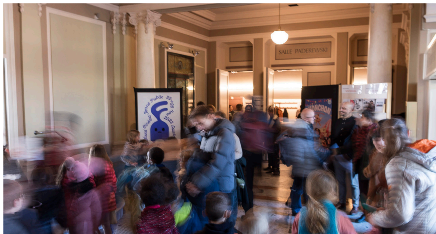
Cérémonie d'ouverture de la 9e édition à la Salle Paderewski du Casino de Montbenon.

Ainsi, en 9 ans, notre structure est devenue un centre de référence pour la médiation du cinéma et la programmation de films jeune public proposant des contenus sélectionnés avec soin pour des institutions culturelles, pédagogiques et sociales.