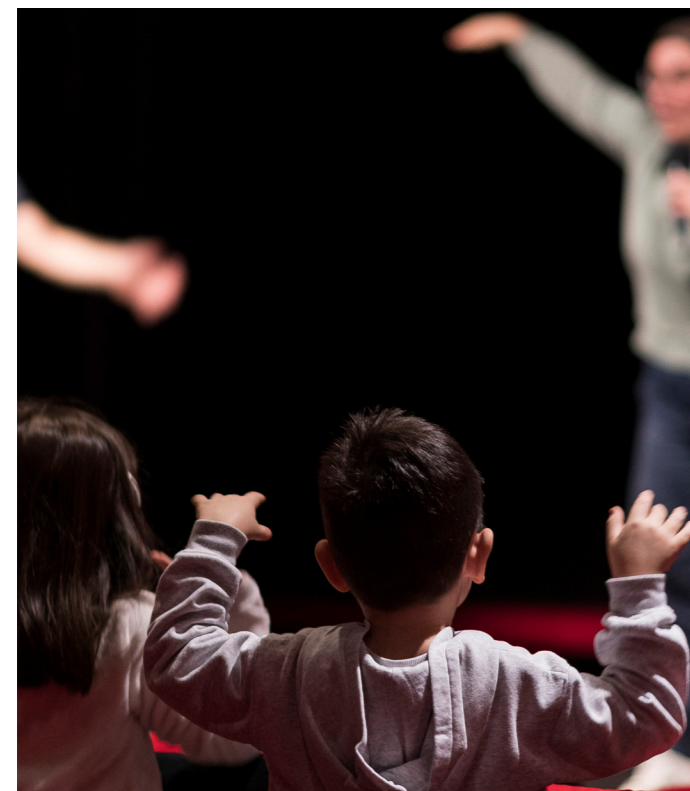
Projection spéciale ponctuée d'activités pour les bénéficiaires de l'EVAM

Grâce à ces projets, le Festival réaffirme ses missions d'accessibilité et d'inclusivité qui améliorent la participation citoyenne et permettent d'élargir le choix des possibles de chacun·e.