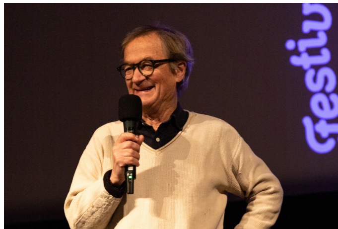
Georges Schwizgebel, réalisateur de Retouches