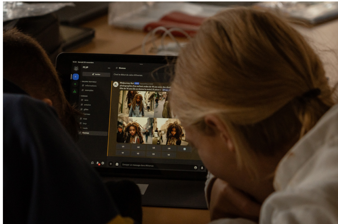
Atelier IA : Imaginaires artificiels, pour les jeunes de 12 à 14 ans

Depuis 2022, le Festival est régulièrement invité par la Haute École Pédagogique de Lausanne (HEP VAUD) pour former les futur·e·x·s enseignant·e·x·s en médiation culturelle du cinéma à intégrer du contenu audiovisuel et cinématographique dans leur cours.