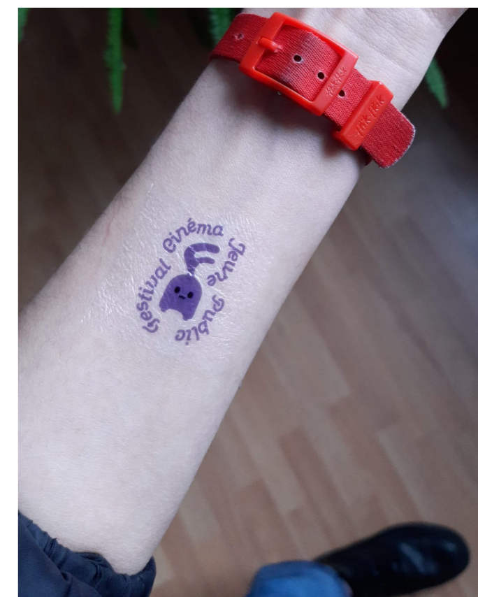
Tatouage éphémère de la 9e édition