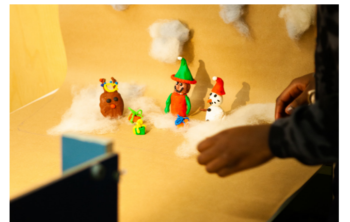
Atelier de stopmotion à la maison de quartier des Faverges