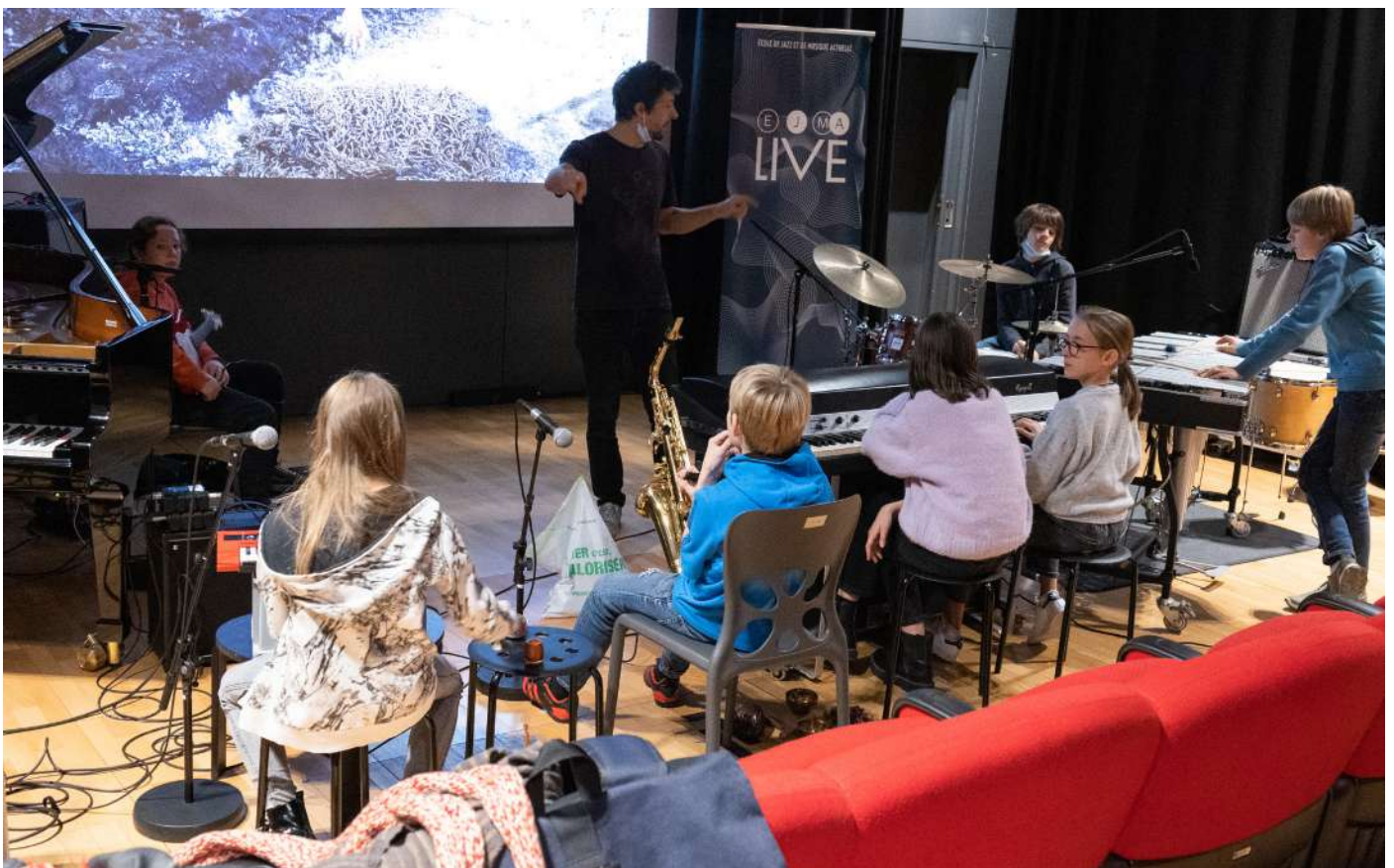
Atelier création musicale

Grâce aux collaborations avec des structures accueillant des enfants et des jeunes, notre équipe de médiation a en outre proposé des projets qui permettent l'inclusion de publics très diversifiés. Par la richesse et la diversité de ses propositions, Le Festival a réussi à sensibiliser son public et à valoriser le cinéma comme une expérience culturelle et collective plutôt que comme une expérience individuelle et de consommation.