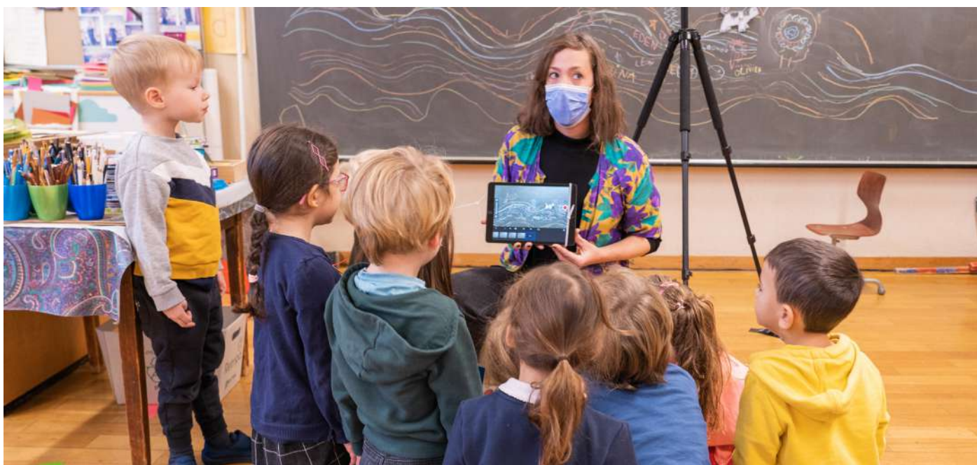
Réalisation d'un mini métrage

• Jury des classes du Cycle II de l'établissement de Renens-Est l'objectif étant de développer l'esprit critique des élèves au sujet du médium filmique, de les inciter à exprimer leurs opinions et de débattre dans un cadre respectueux.