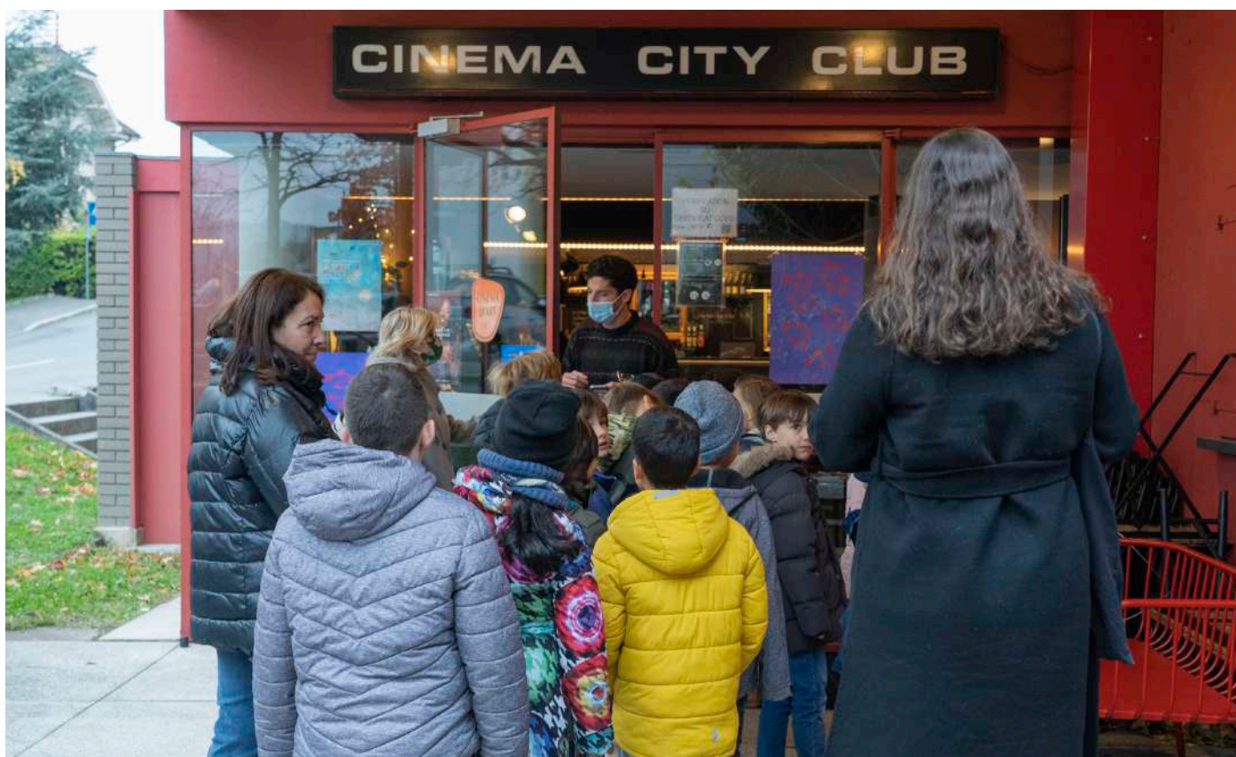
Séance scolaire au Cityclub de Pully dans le cadre de la 7e édition du Festival

élèves (49 classes) ont participés à des ateliers de médiations du cinéma en classe