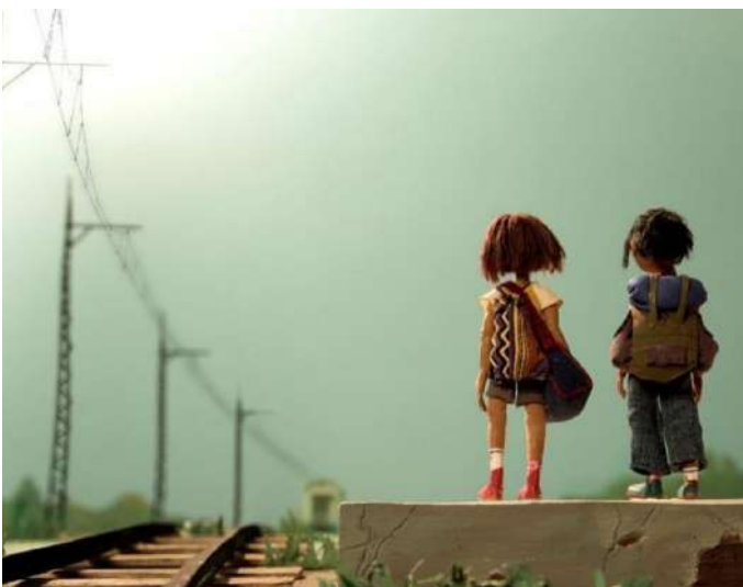
Anna et Manon vont à la mer , Catherine Manesse (FR, 4', 2020)