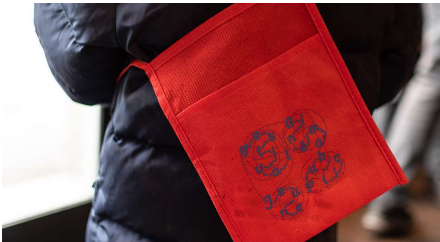
Pochette aux couleurs de la 7e édition