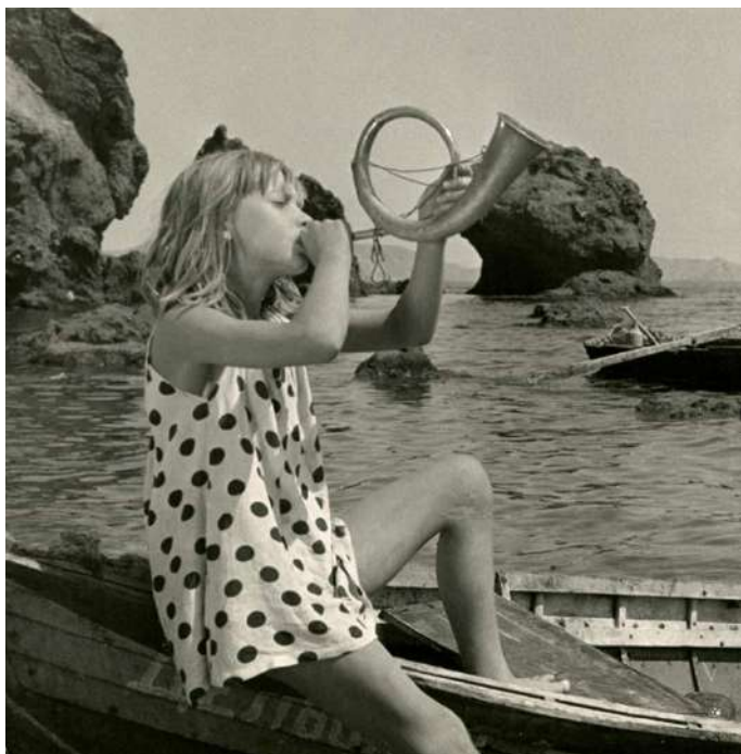
La jeune fille à l'écho , Arunas Zebriunas (LT, 66', 1964)