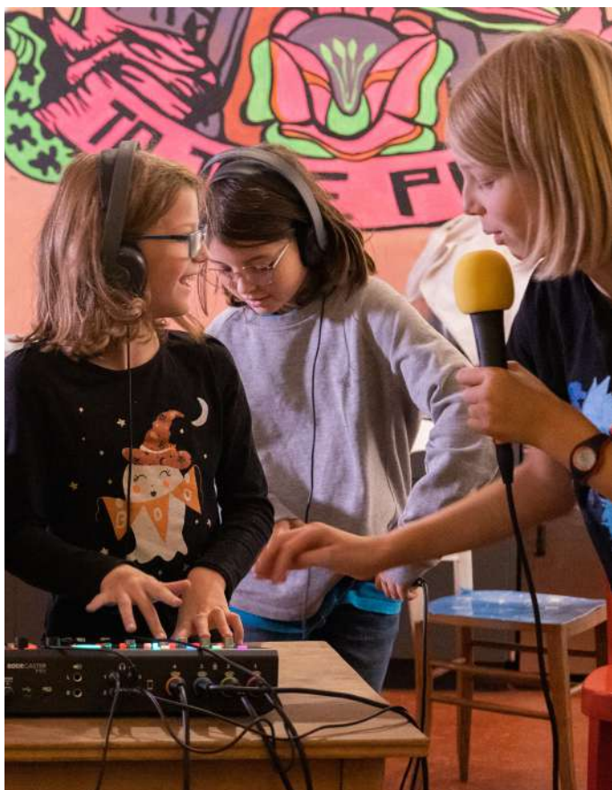
Atelier création de podcasts

Encadré·x·e-s par les musiciens et enseignants Benoît Moreau et Marcin de Morsier, un groupe d'enfants a présenté un ciné-concert pendant le Festival. Cette année, ils et elles ont créé une musique originale pour le film Pierre et le Loup de Suzie Templeton (EN, 29', 2006).