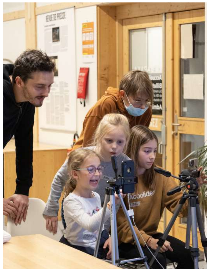
Comment devenir une licorne sympa