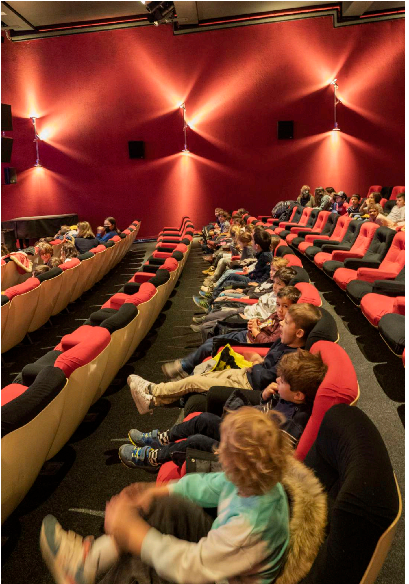
Séance scolaire au Cityclub de Pully dans le cadre de la 7e édition du Festival