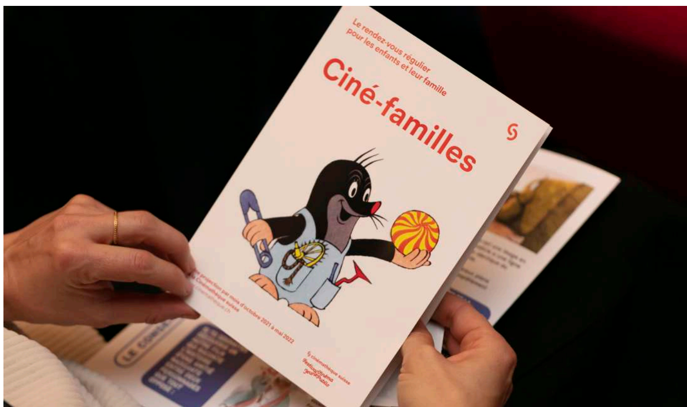
Brochure Ciné-familles

Avec la Cinémathèque suisse, depuis septembre 2021, le Festival programme un cycle de films pour le jeune public, à raison d'une projection mensuelle. Chaque film ou programme de films est présenté par une médiatrice ou un médiateur du Festival et est accompagné d'un kit de médiation pour échanger sur le film et bricoler en s'inspirant des techniques utilisées dans le ou les films.