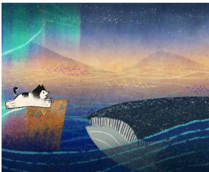
Alyaska , Oksana Kuvaldina (RU, 7', 2020)