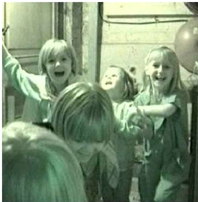
Éléonore et ses amies , Philippe Jadin (BE, 2', 2001)