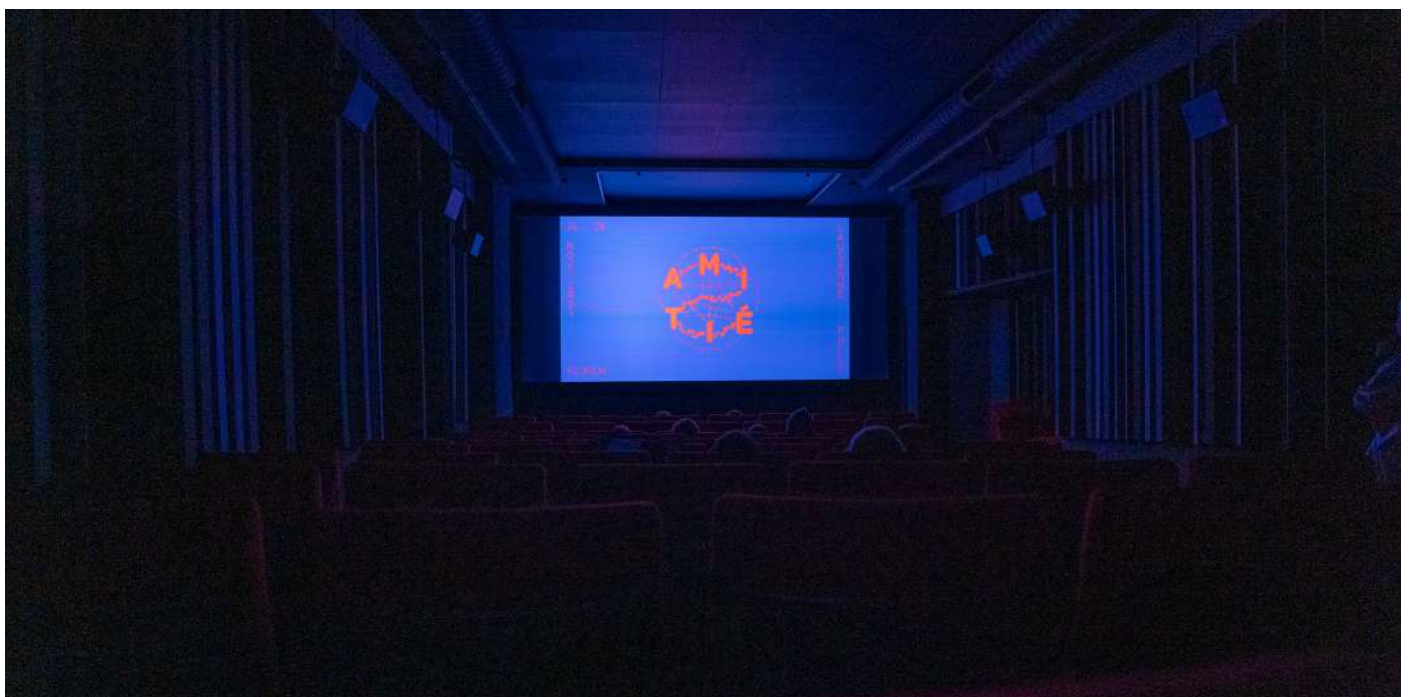
Séance au cinéma de Bellevaux