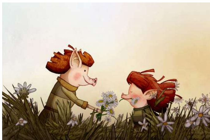
Anina , Alfredo Soderguit (UR, 80', 2013)