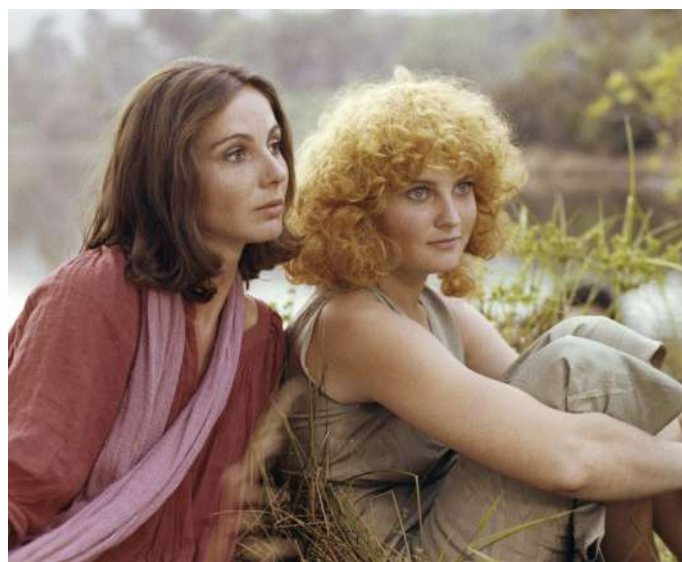
L'une chante, l'autre pas , Agnès Varda (FR, 120', 1977)