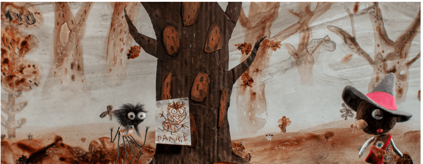
Cœur Fondant , Benoît Chieux (FR, 7', 2019)

Les spectatrices et spectateurs du Festival ont voté à l'issue des séances des programmes de courts métrages. Le film qui a reçu le plus de votes est Cœur Fondant de Benoît Chieux (FR, 7', 2019). Le cinéaste a reçu un prix d'une valeur de CHF 500.- doté par les librairies Payot.