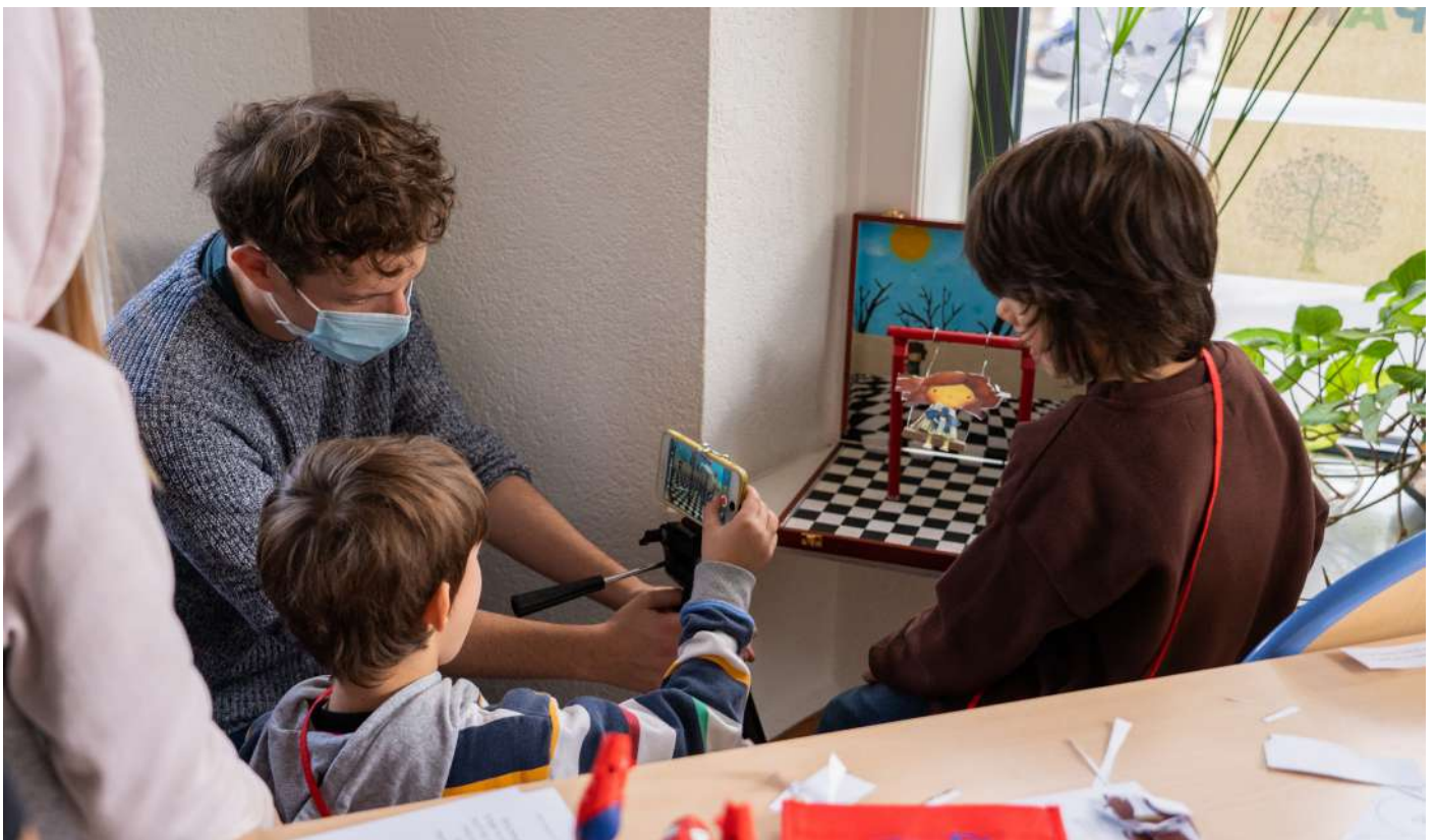
Atelier stop motion

Pendant le Festival, une projection était réservée pour les Centres de vie infantile de Lausanne. La projection a fait salle comble – plus de 90 enfants et éducatrices et éducateurs venant de 5 centres ont pris place au cinéma Bellevaux et ont apprécié la diversité et la poésie des films proposés. Les retours des responsables ayant été extrêmement positifs, il a été décidé de poursuivre et de privilégier cette collaboration en 2022.