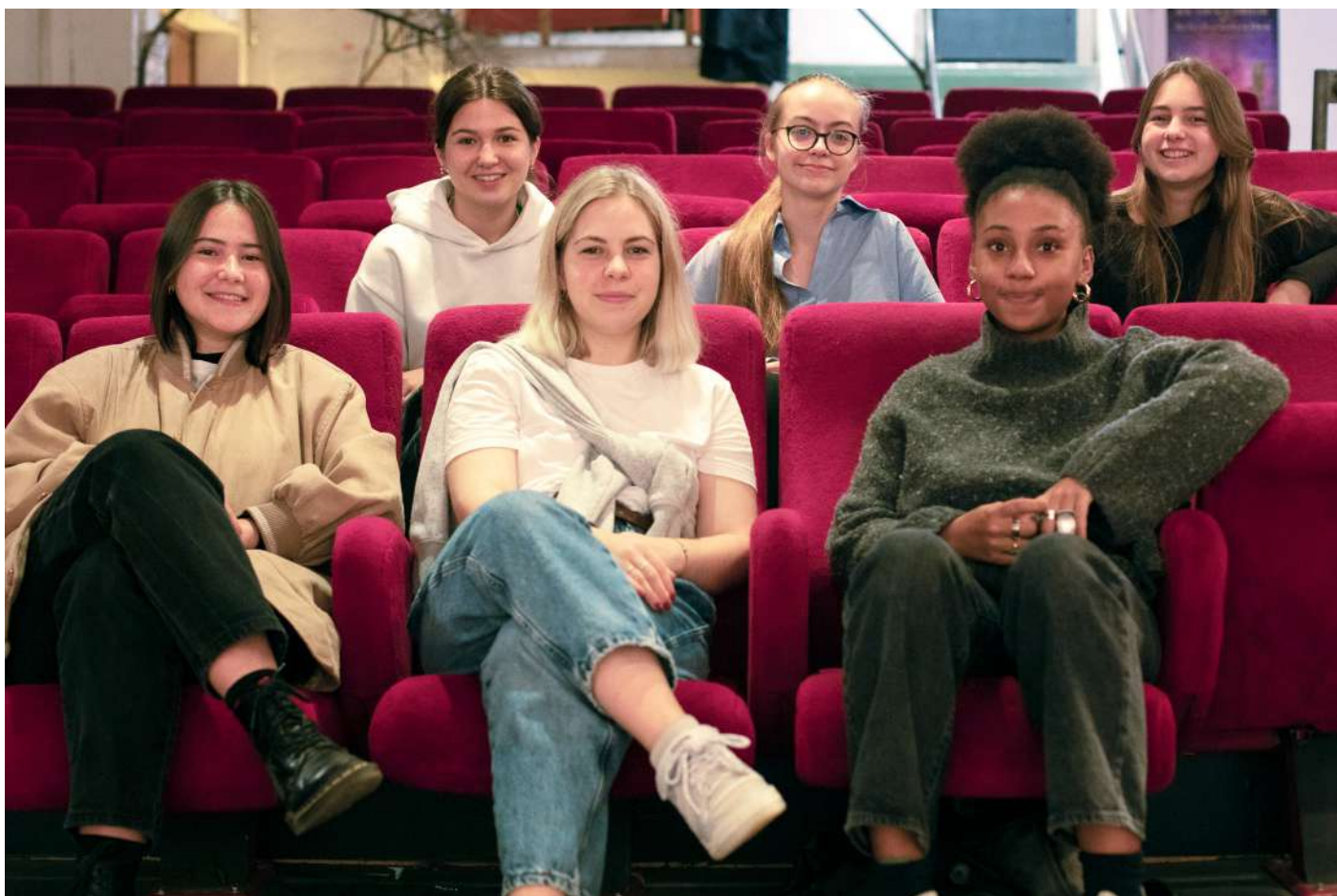
Comité de programmation des jeunes

Six adolescentes et jeunes adultes ont participé à la programmation du Festival en visionnant 3 films. Elles ont sélectionné L'une chante, l'autre pas de Agnès Varda (FR, 120', 1977) qu'elles ont ensuite présenté au public du Festival à deux reprises.