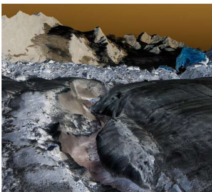
Aletsch négatif , Laurence Bonvin (Suisse, 2019, 11')