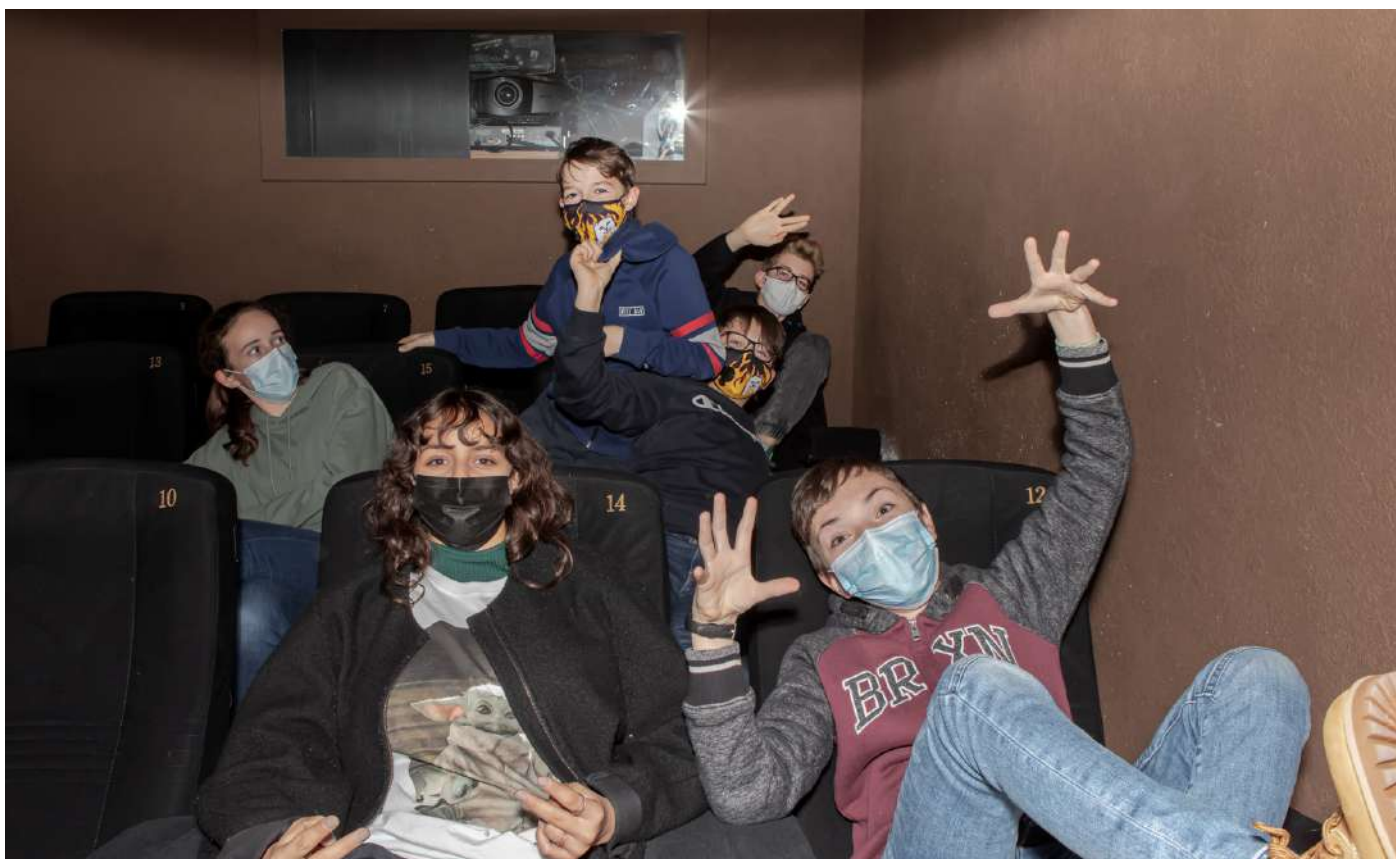
Le Jury des jeunes au Zinéma

Atelier imaginé par le Théâtre de Vidy et l'artiste et metteur en scène Simon Senn. Créer son clone numérique à animer grâce à un casque de réalité virtuelle.