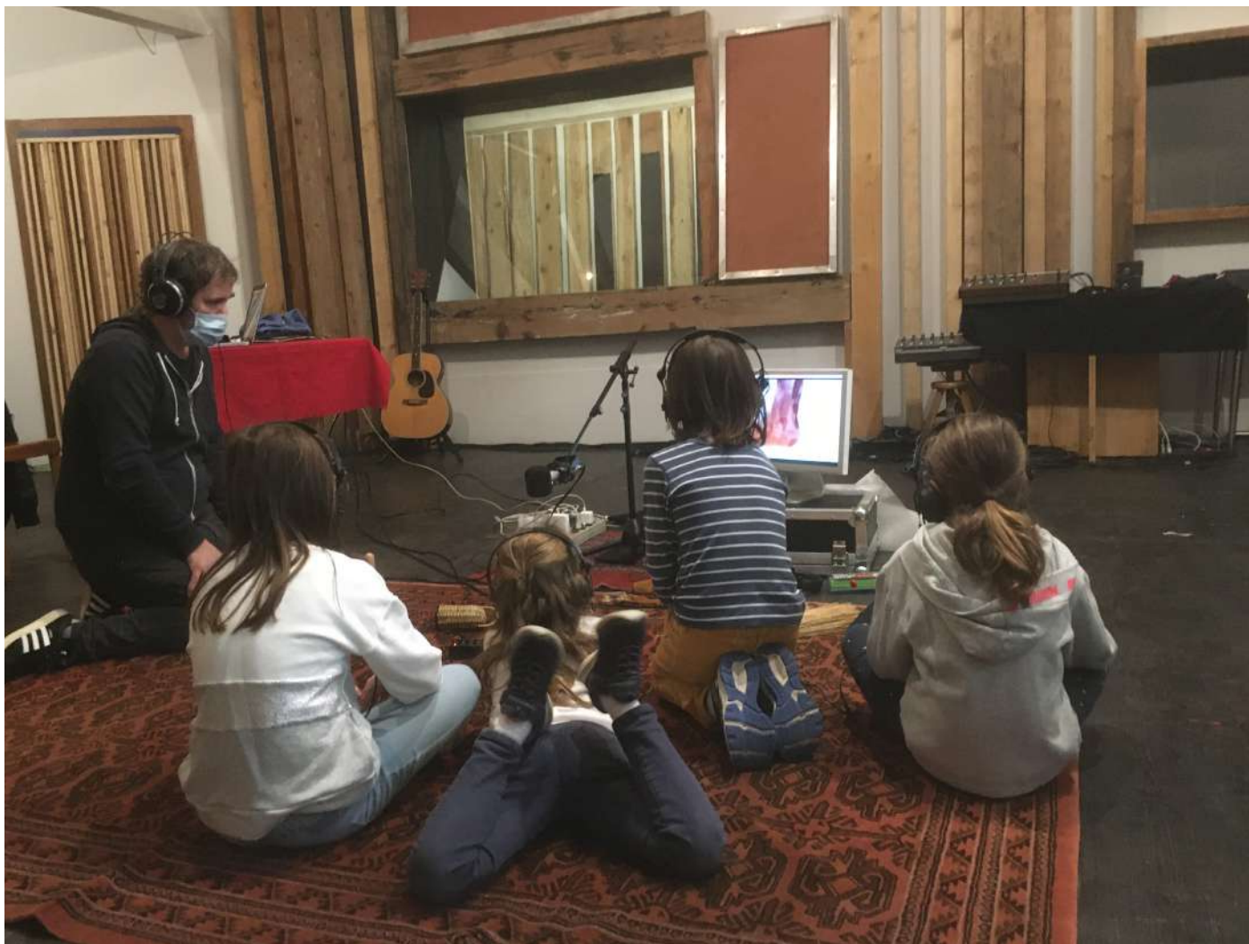
Atelier «Bruits Sauvages» créé par Marcin de Morsier

5 jeunes adultes ont participé à la programmation du Festival en visionnant 3 films et sélectionnant Swarm Season de Sarah J. Christman (USA, 86', 2019), proposé au public et accessible en ligne. fermé à cause du contexte sanitaire.