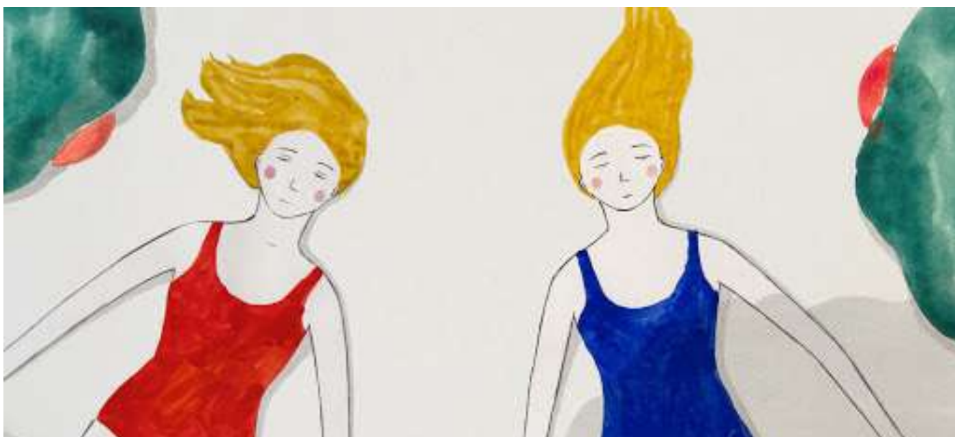
Circuit de Delia Hess - Prix du jury des enfants