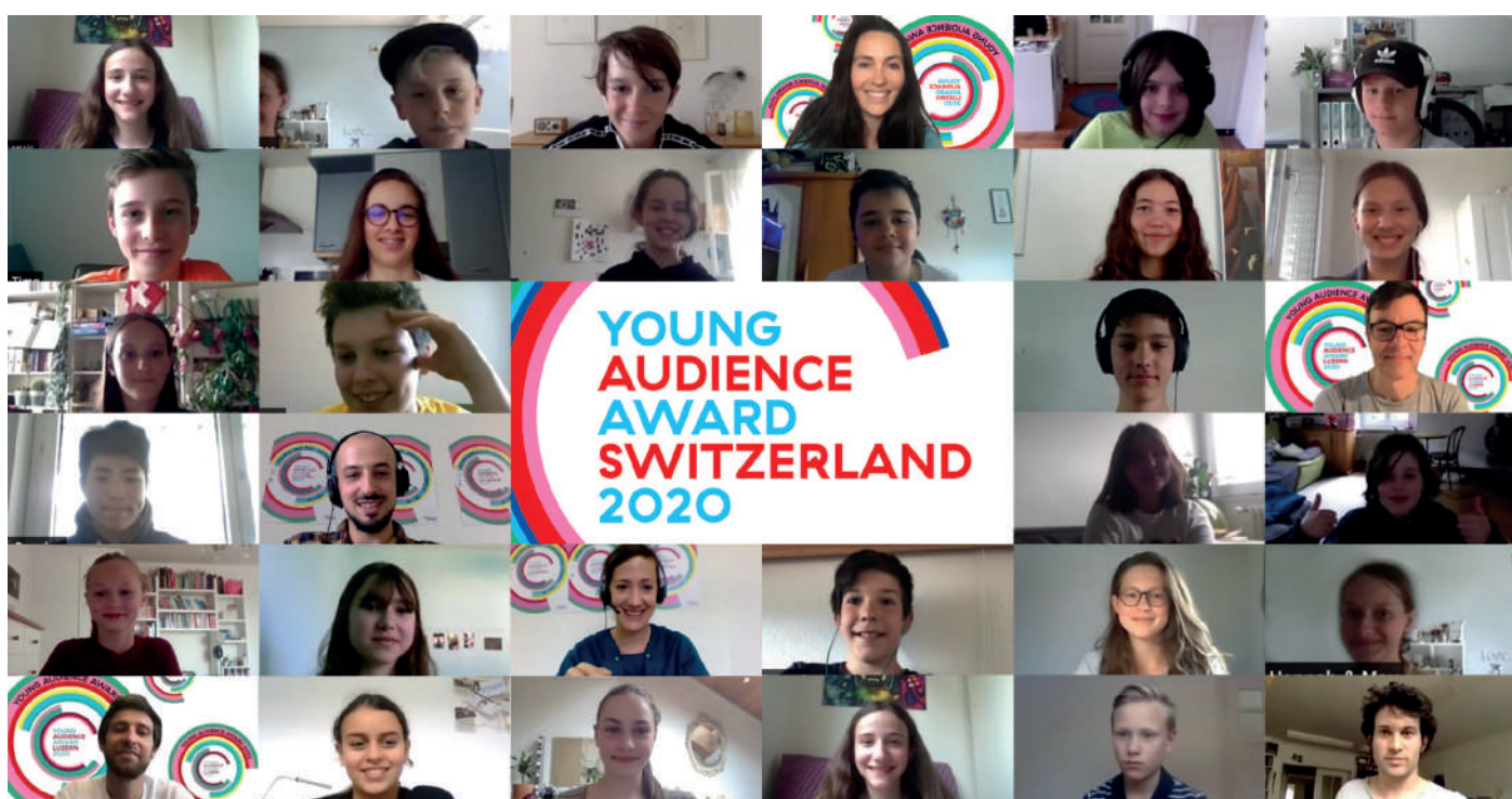
Les participant·x·e·s suisses romand·x·e·s et suisses allemand·x·e·s du jury de l'édition 2020 en ligne du Young Audience Award