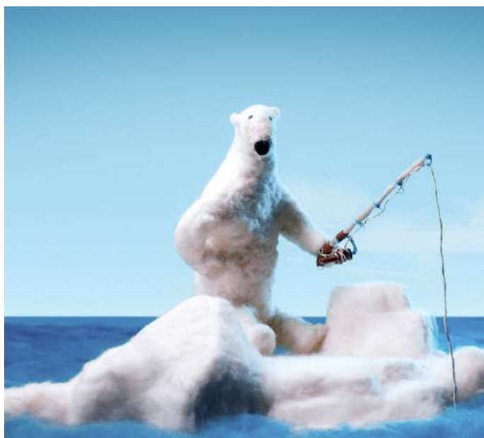
Ah ces p'tits humains ! , Romain Gautreau (France, 2019, 4')