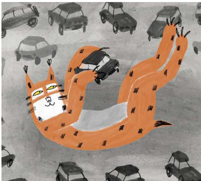
Un lynx dans la ville , Nina Bisiarina, (France, Suisse, 2019, 7')