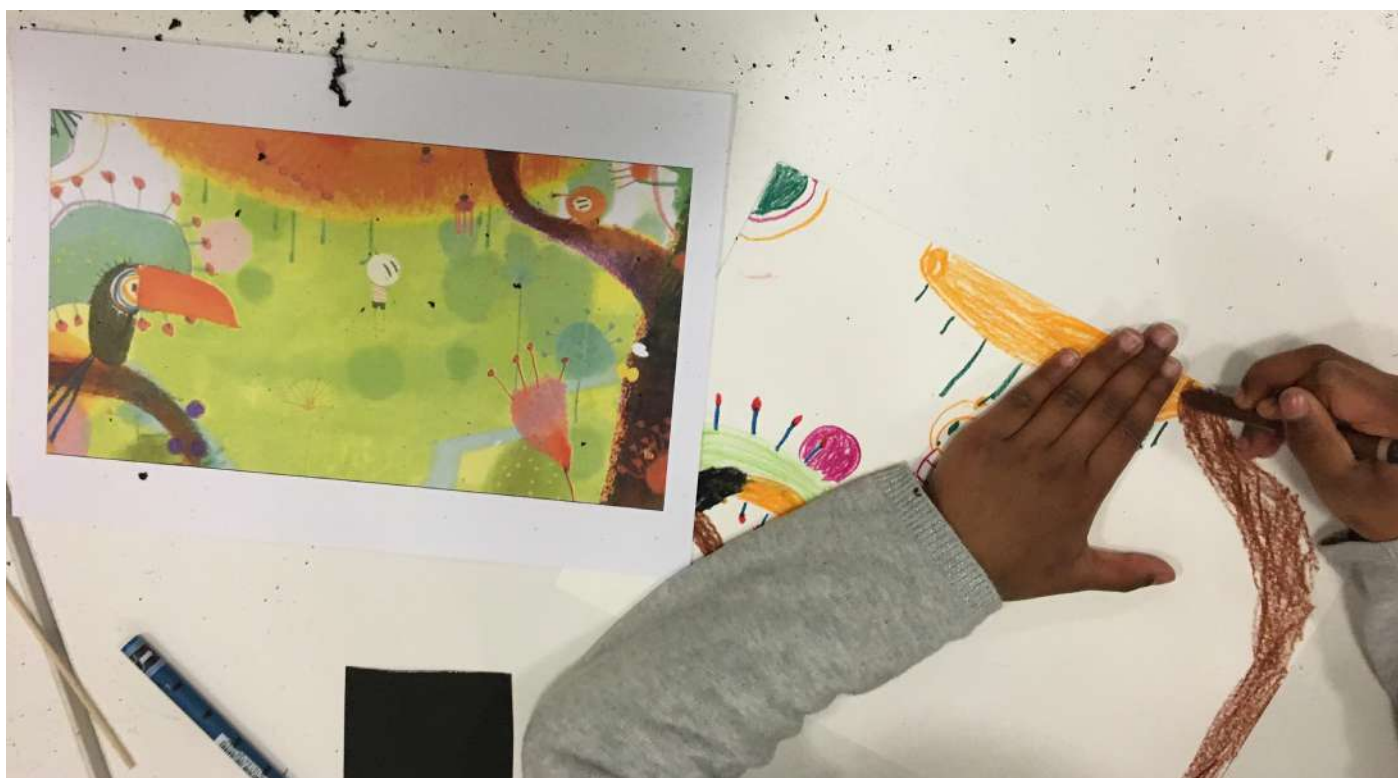
Atelier autour du film Le garçon et le monde dans une maison de quartier lausannoise

42 enfants et 8 accompagnant·x·e·s ont assisté à une projection et ont participé à un atelier dans l'établissement