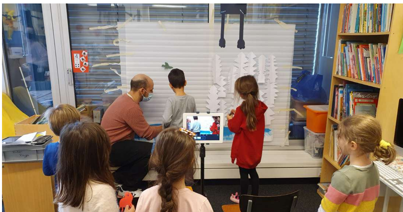
Atelier de réalisation d'un mini film d'animation avec une classe de 1P-2P de l'EP Pully-Paudex-Belmont