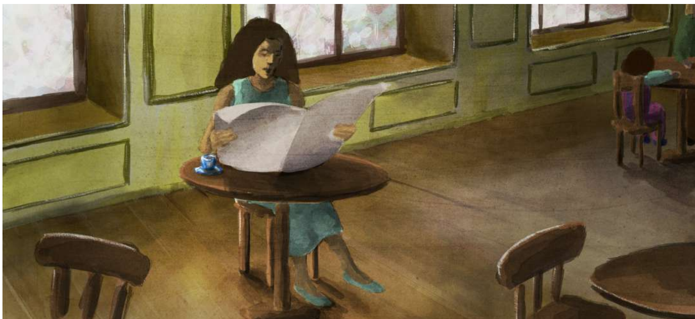
Newspaper News de Sophie Laskar-Heller - Prix du jury des jeunes

Le Jury des enfants a également choisi de donner une mention spéciale à Pourquoi les limaces n'ont pas de jambes de Aline Höchli (Suisse, 2019, 10').