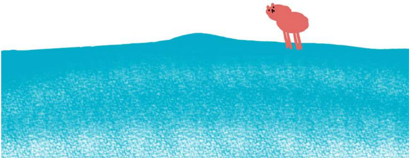
Image tirée du teaser de l'édition 2020 réalisé par Marjolaine Perreten

Cette démarche va également dans le sens du Festival soucieux de susciter des vocations auprès des jeunes en présentant des créations de cinéastes formé·x·e·s dans les hautes écoles et écoles professionnelles de la région.