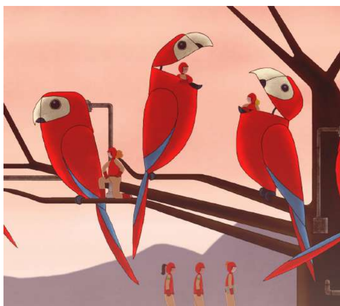
Floreana , Louis Morton (Etats-Unis, Danemark, 2018, 4')