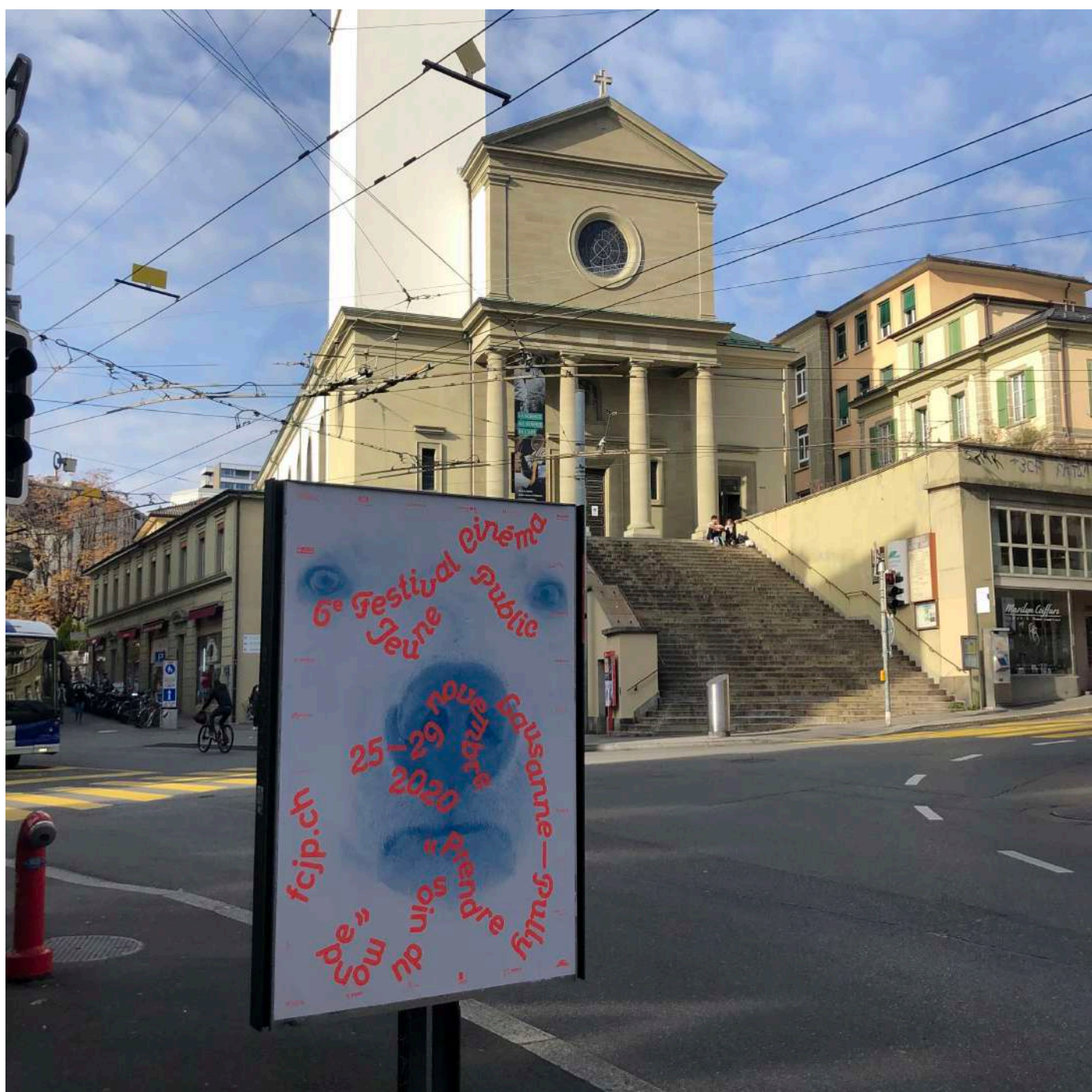
Campagne d'affichage en Ville de Lausanne, novembre 2020

150 paquets de graines Zollinger offerts aux participant·x·e·s d'un concours initié par le Festival ainsi qu'aux membres des ateliers, aux cinéastes locaux et internationaux et aux partenaires de l'édition