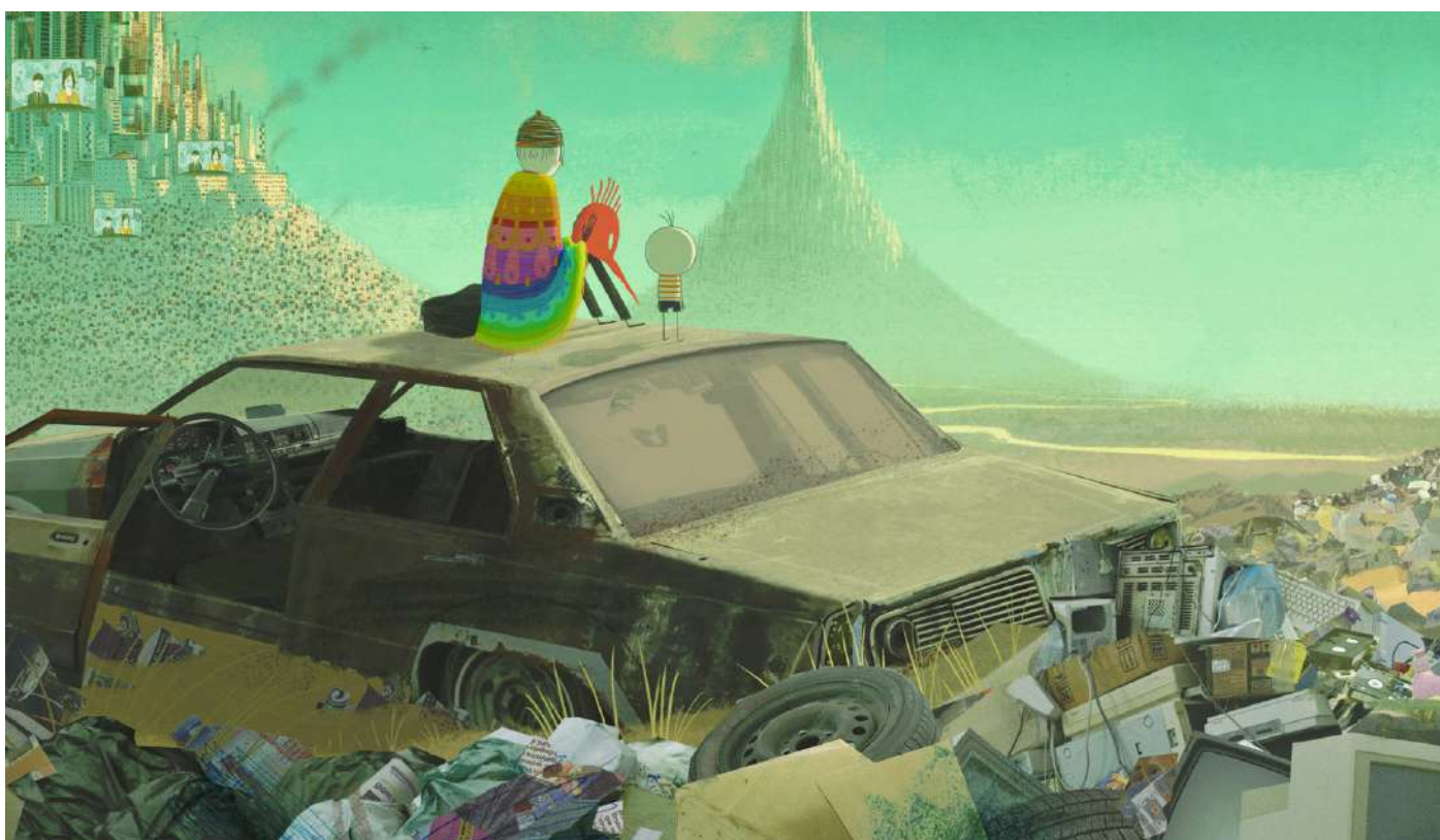
Le Garçon et le Monde , Alê Abreu (Brésil, 2013, 80')

Depuis sa première édition, le Festival met en lumière la relève du cinéma suisse en donnant une forte visibilité aux films de jeunes cinéastes créant en Suisse. Cette année, ce sont deux films suisses qui ont reçu des prix. Fidèle à son engagement artistique, l'équipe du Festival a également retenu des productions indépendantes peu montrées dans les circuits de la grande distribution.